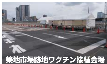
築地市場跡地ワクチン接種会場

ワクチンはコロナ対策の有効な手段であり、まさにゲームチェンジャーである。都は今年 2 月に立ち上げた「ワクチンチーム」で区市町村や関係団体と緊密に連携をとり接種の促進を図ってきたが、都がこれから設置する大規模接種会場の選定も区市町村の接種計画や地域のバランスを考慮し具体的に検討する。