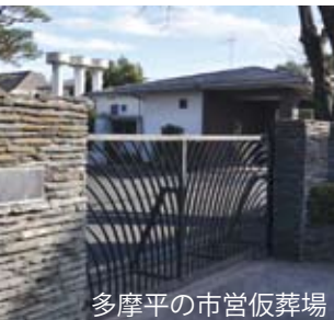
多摩平の市宮仮葬場

12月議会にて、大型の一般会計補正予算が可決されました(2面参照)。私が以前から課題として挙げていた案件においても、補正予算が組まれ事業が進展することとなりました。地道に市に働きかけを行ってきた結果と思います。次は「火葬場移転建設」を課題とし、実現に向けて努力をしたいと思えます。