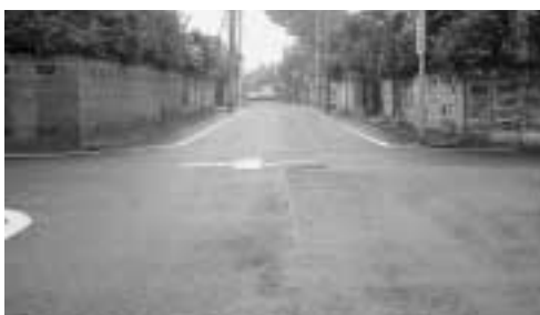
ガス管の安全は！（ガス管布設替箇所）

A 震災時におきましては、地域防災計画にもとずきましてガス施設に被害が生じた場合には、二次災害の発生を防止すると共に速やかに応急措置を行ないライフライン施設として機能を維持する事となっています。ガス会社に確認したところ市内ガス管延長約400キロメートルのうち380キロメートルにつきましては、耐震化を行ってると言うことで残りについても順次整備していくという答えを頂いています。