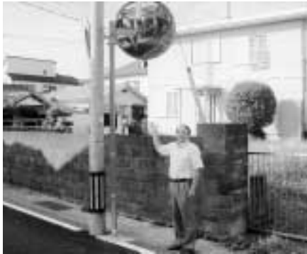
日野7773番地先 (カーブミラー設置)