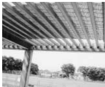
仲田スポーツ公園 (よじずり取り替え)