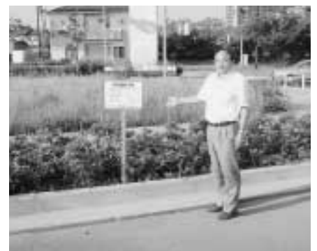
東町区画整理地内 (ペットマナー表示)