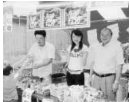
社会弱者のために！（福祉祭りにて）