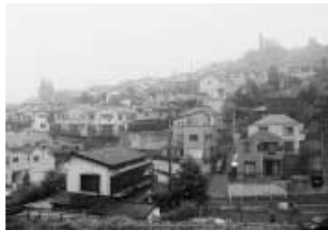
宅地造成工事規制区域を望む！

* 土砂流出災害と共に地震発生時における宅地の安全確保の確認を市としても行うようお願いしました。（宅地造成工事規制区域は主に川崎街道、北野街道の南側の丘陵地帯です。）