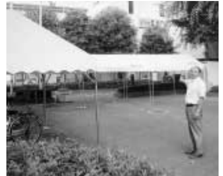
健康・保健センター地内 (新しいテントへ！)