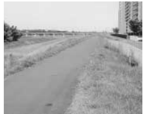
舗装整備はされたが！

A 河川管理者である国土交通省河川事務所に確認したところ、市内の多摩川堤防延長は6.6キロメートル、このうち整備済の延長は程久保川の下流0.6キロメートル、残りの未整備部分6.0キロメートルのうち4割は堤防の高さ不足、また、6割は堤防の厚さ不足である。堤防改修計画は、河川全体の中で優先順位をつけて実地されています。堤防の高さ不足や厚さ不足を改修するには、新たな用地確保の問題もあり時間がかかります。今後、市としても市民の安全・安心のため、国に対し多摩川・浅川の堤防の整備について要請していきます。