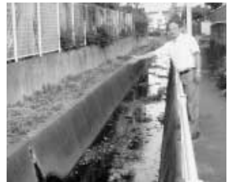
日野警察署裏 (水路清掃・除草)