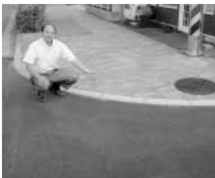
東町区画整理地内 (ブロック補修)