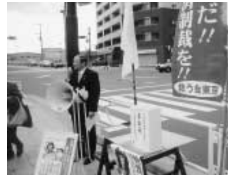
拉致被害者のために！