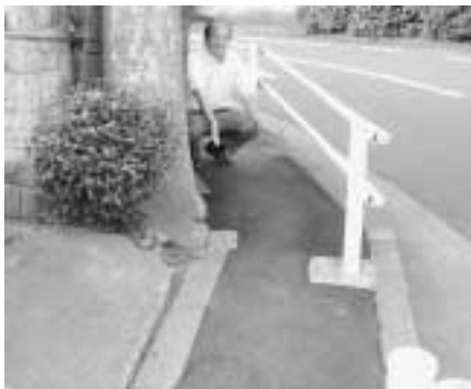
日野本町4-2番地先 (段差解消)