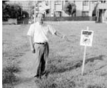
万願寺第2区画整理地内 (ペットマナー表示)