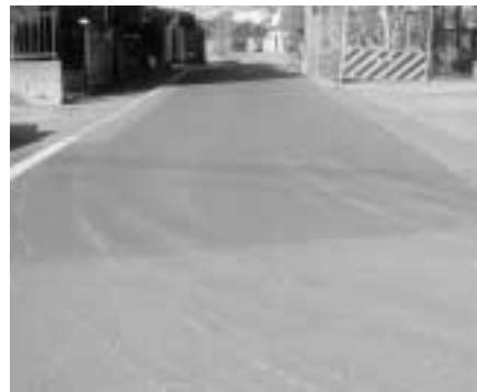
東町区画整理地内 (水たまり解消)