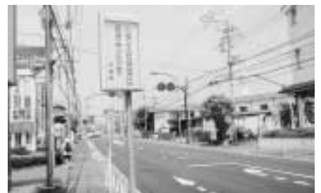
大地震発生時車両通行禁止の看板！

A 地震時には、道路に看板や電柱の倒壊など障害物が散乱することが予想され、被害者の救護や救護活動はもちろん緊急物資の輸送に支障が生じることがあります。今後、市としても都が指定している緊急啓開路線と市の防災拠点とを結ぶ市道等を啓開路線として選定するよう検討します。