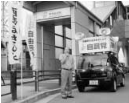
街頭での議会報告！